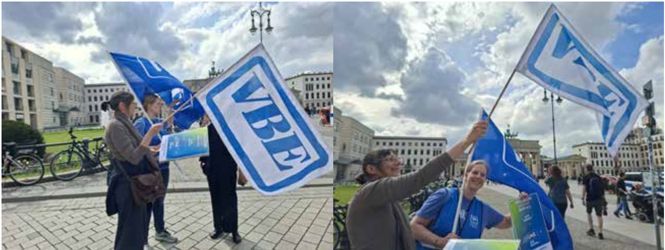
VBE-Kolleginnen und -Kollegen bei der Demo am 5. Mai 2026 anlässlich des Protesttages zur Gleichstellung von Menschen mit Behinderung.