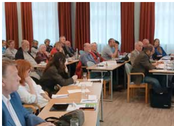
Geschäftsführender Vorstand und Delegierte des VBE Berlin