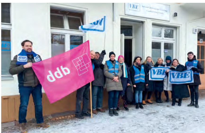
Streikende VBE-Kolleginnen und -Kollegen am 27.01.2026 vor der VBE-Geschäftsstelle