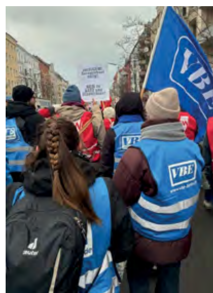
VBE-Mitglieder beim Warnstreik am 29.01.2026 in Berlin und am 11.02.2026 in Potsdam.